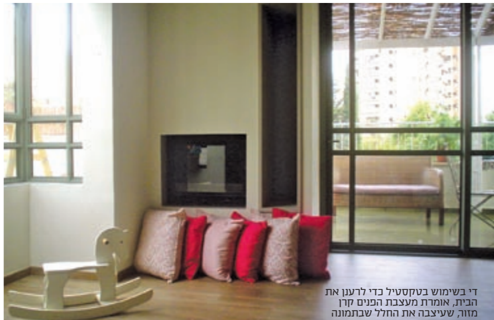
די בשימוש בטקסטיל כדי לרענן את הבית, אומרת מעצבת הפנים קרן מזור, שעיצבה את החלל שבתמונה

מעצב ימקד אותך וימנע ממך לעשות טעויות שיעלו לך ביוקר. אנשים שלא מבינים עושים טעויות טכניות ועיצוביות, ואחר כך הם צריכים לחיות איתן או לשלם כפול כדי לתקן ולהחליף