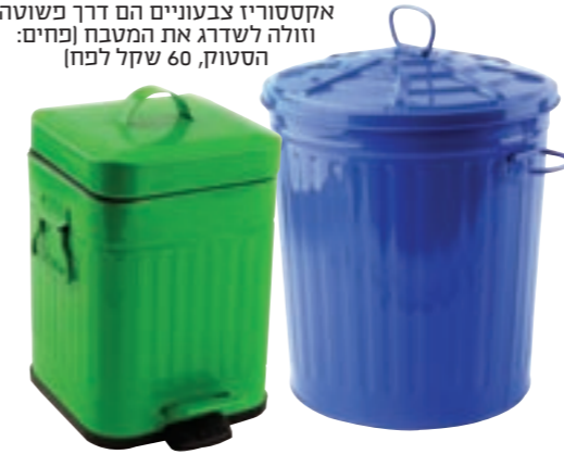
אקסטרוזיציה צבעונית הם דרך פשוטה וזולה לשדרג את המטבח (פחים: הסטוק, 60 שקל לפח)

שדרוג הבית באול, שקשה מאוד לעמוד בו: לקבוע תקציב מראש ולא לחרוג ממנו.