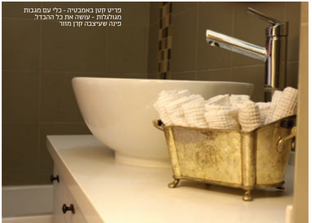
פריט קטן באמבטיה - כלי עם מגבות מגולגלות - עושה את כל ההבדל. פינה שעיצבה קרן מזור

כשאני שיפצתי את המטבח, אפילו הנגר ניסה לשכנע אותי לשים לוח זכוכית מעל הכיריים.